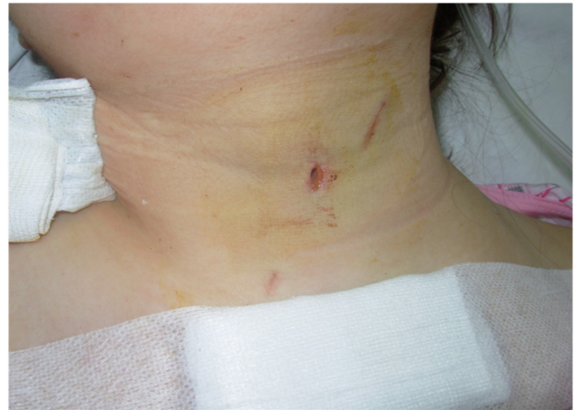
Resim 2. Kesici delici alet ile yüksek servikal yaralanma