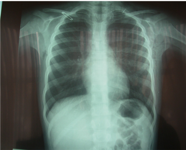
Resim 1. İyileşme döneminde çekilen PA akciğer grafisi

Bronkoskopik olarak yaralanma trakea veya bronşun çevresinin dörtte birinin 1/3'ünden azsa, tüp drenajı ile hava kaçağı kesiliyorsa ve tam ekspansiyon sağlanmışsa konservatif kalınması yeterli olmaktadır (5). Ayrıca endoskopi özefagus yaralanmaları ekarte etme açısından gereklidir. Konservatif yöntemler arasında entübasyon, trakeostomi ve gözlem bulunmaktadır. Trakeostomi, intratrakeal basıncın düşürülmesi, sekresyonların aspirasyonu ve ventilatör desteği açısından çok kolaylıklar sağlar. 2 cm ve daha aşağı servikal yaralanmalarda eşlik eden patoloji yoksa konservatif olarak yara bakım, hidrasyon, sekresyonların atılması ve pulmoner komplikasyonları takip yeterli olmaktadır. Servikal trakeal yaralanmalarda çevre vasküler yakın komşuluklar olduğundan bu organların yaralanmalarında görülmektedir. Bizim olgularımızda sadece 1 vakada plevra olaya iştirak etmiş olup diğer vakalarımızda izole yaralanmalar olmuştur. Anterior pozisyonda penetran yaralanmalarda %10 en fazla etkilenen organ farinks ve özefagus olup sırasıyla %9 jugular ven, %6.7 karotid arter, %3 spinal sinirler olmaktadır (7). Genellikle servikal penetre travmalar kesici delici alet yaralanmaları ile ve mağdurun mücadelesi ile ani ve hızlı bir şekilde olmaktadır 1 vakamızda servikal trakeal yaralanma ile birlikte sağ el avuç içi laserasyonunda suture edilmiştir. Silahla yaralanmalarda yakın atışlarda oluşan kinetik enerji aynen künt travma gibi etki yaparak laringeal